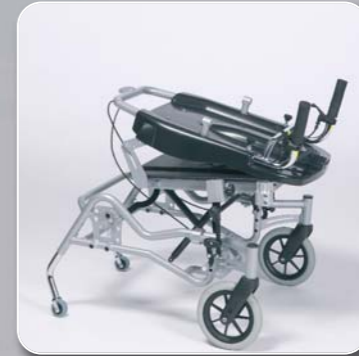
faltbar für den Transport