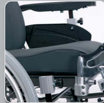
Armlehnen abnehmbar und in der Tiefe, Höhe und Breite einstellbar