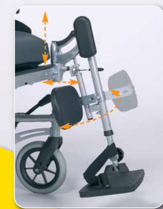
Wadenplatten sind wegklappbar, abnehmbar, einstellbar und winkelverstellbar