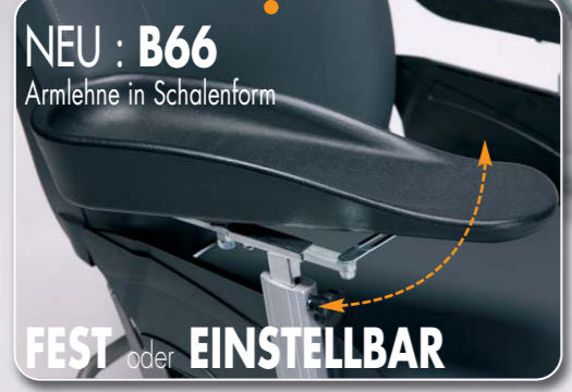
NEU : B66 Armlehne in Schalenform