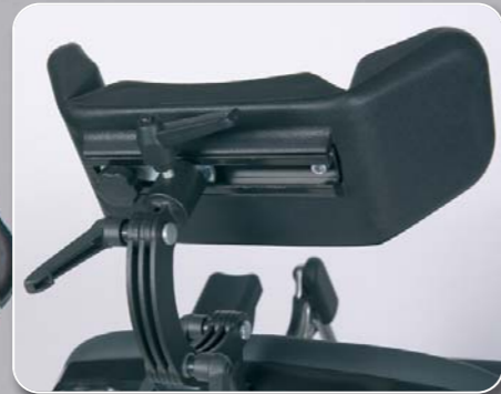
Individuell einstellbare Kopfstütze