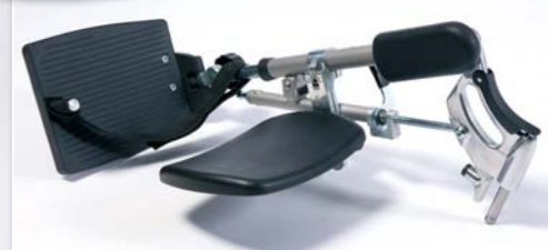
BZ7 - Beinstützen