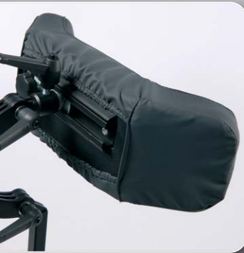
Option: Komfort Kopfstütze