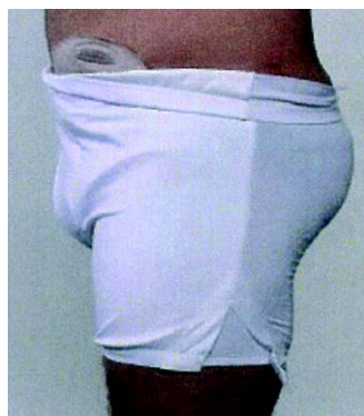
Herren-Schutzhose Art. Nr. 9003 weiß Gr. S - XXL