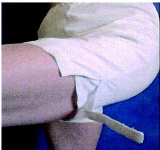
Ansicht Klettverschluss Schutzhose

Mit Bein-Klettverschluss zum Anpassen des Beinumfangs - für einen guten Abschluss.