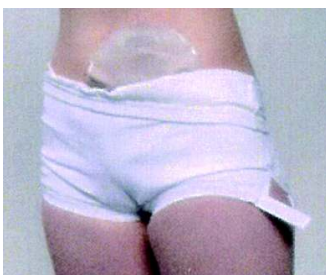
Damen-Schutzhose Art. Nr. 8005 weiß Gr. S - XXL